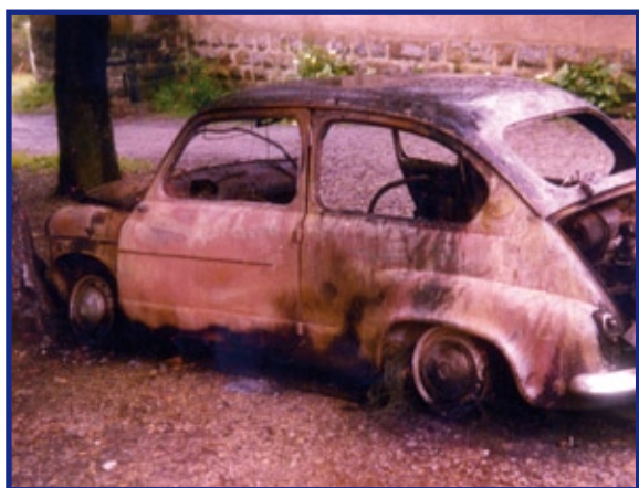
Estado en que quedó el coche SEAT 600 propiedad del cura de Kanala después de ser incendiado por el GOSSI.

de la vida, creó ambiente incluso desde la víspera, siendo el acaparamiento de alimentos ostentoso y el nerviosismo y psicosis evidente. En Gernika-Lumo la huelga fue general, con cierre del comercio y servicios, y paro total en las fábricas, salvo en la empresa JYPSA, donde únicamente pararon medio centenar de trabajadores de una plantilla de 700 6 .