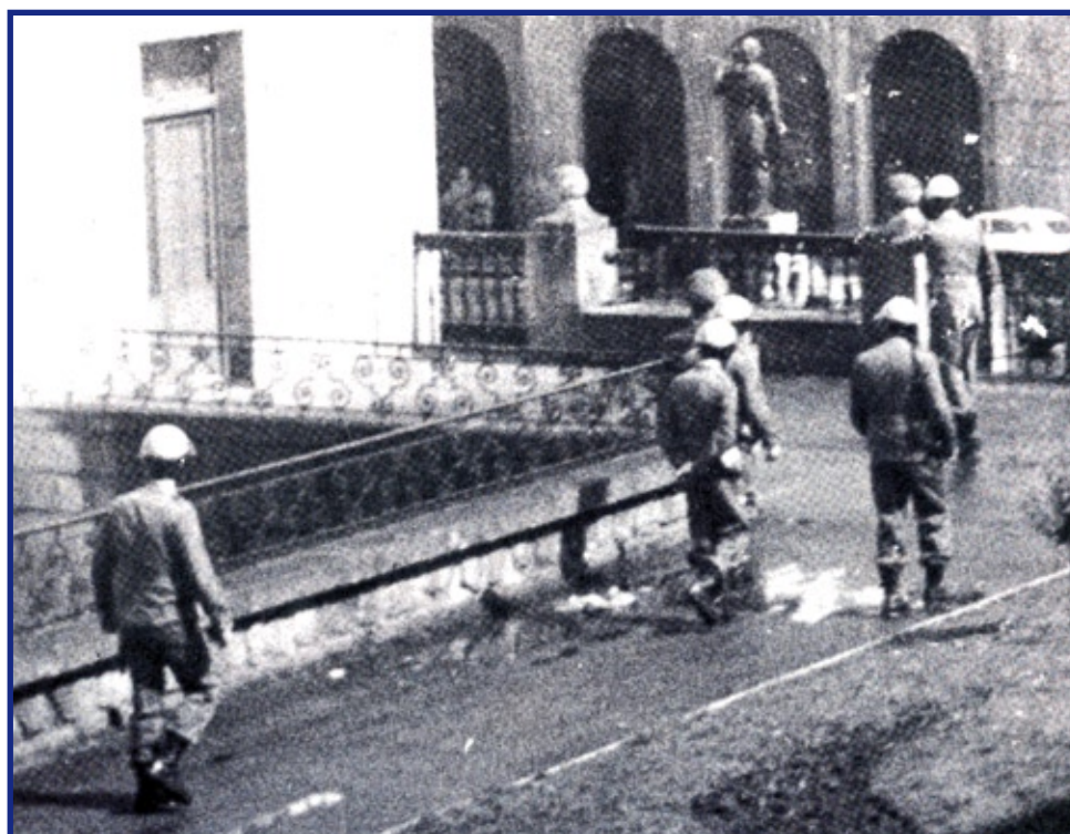
Aberri Eguna 1975. La Policía Armada (los "grises") en el parque de M. Iturrarán, actual Elai Alai, vigilando y disolviendo manifestantes.

la guardia civil, incautándose en algunos de numerosos libros, postales, grabados de Ibarrola, el "Guernica de Picasso", etc. La ignorancia de los guardias llegó hasta el extremo de incautarse libros del siglo XIX y anteriores, argumentando que no poseían Depósito Legal, cuando este requisito administrativo se implantó en el XX.