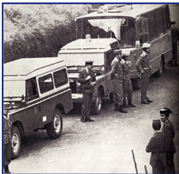
Unidades de Policía Armada (los "grises") en los alrededores de Gernika-Lumo. Marzo de 1975.

Las tensiones existentes entre los Frentes Obrero y Militar de ETA entre los años 1972-73 y el debate sobre que tipo de lucha priorizar -la actividad militar o la lucha obrera o de masas- habían llevado al Frente Obrero a abandonar en marzo de 1974 la organización,