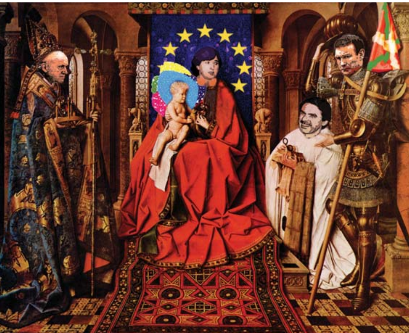
LA VIRGEN DEL CANÓNIGO VAN DER PAELE. VAN EYCK. MUSEO MUNICIPAL DE BRUJAS.