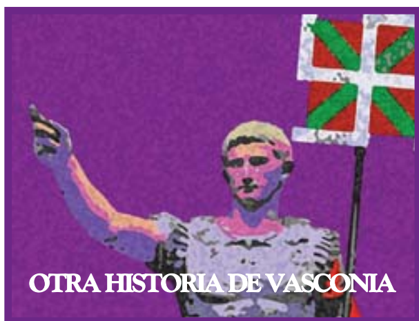
OTRA HISTORIA DE VASCONIA

Los últimos tiempos están siendo ricos en información arqueológica. Aunque sea por otros intereses: carreteras, aparcamientos, nuevos edificios de viviendas, etc. Lo cierto es que gracias al trabajo de los arqueólogos volvemos a encontrarnos con nuestras verdaderas identidades. Los hallazgos romanos de Pamplona, o Iruña de Oca en el interior, de Irún y Zarautz en la costa por no citar más que algunos, nos van aportando materiales de la convivencia entre los primitivos pueblos indígenas de Hispania y los romanos, muchos de cuyos legionarios y auxiliares no eran romanos sino que procedían de otros pueblos, muchos de ellos peninsulares.