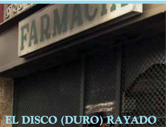
EL DISCO (DURO) RAYADO