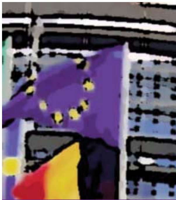
13 DE DICIEMBRE DE 2000. SEDE DEL PARLAMENTO EUROPEO EN ESTRASBURGO

Albert Camus escribió que la larga lista de víctimas del nazismo exigía, al menos dos cosas: conservarlas en la memoria, y si se las había hecho callar, hablar más alto. A todas las víctimas del terrorismo, a su memoria y a su voz acallada que hoy retumba en esta sala dedico este premio. Muchas gracias. "